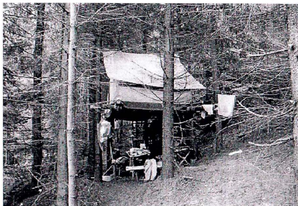
Tábor skautů a vlčat - 2005

Děkujeme všem, co s námi pracují, co nám pomáhají a co s námi sympatizují.