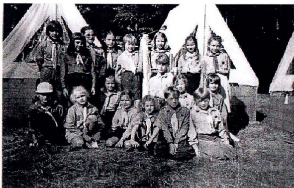
Světlušky na táboře – 1994