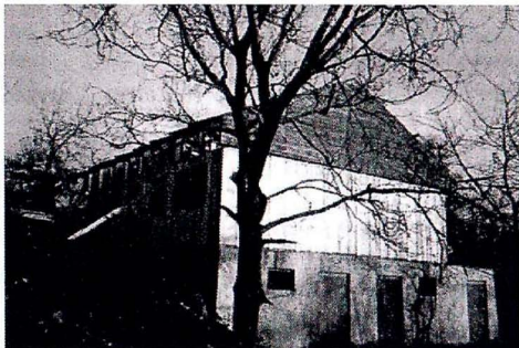
Stavba klubovny - 1994